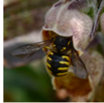
Een grote wolbij met onderbroken gele banden.

Het voorkomen van de grote wolbij in de openbare ruimte is sterk afhankelijk van het beheer. In het stedelijk gebied gaat het om een aantal vrij stabiel overblijvende planten die voor de grote wolbij van betekenis zijn. Dat zijn lokaal en in het buitengebied