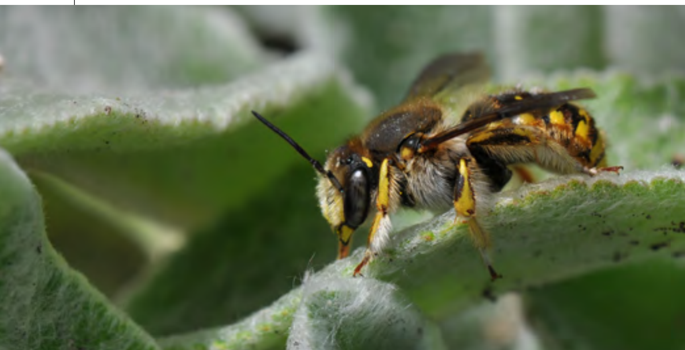
Het mannetje loert op het vrouwtje.

De grote wolbij een juweel? Niet iedereen vindt dat, omdat deze bij oppervlakkig gezien veel meer op een wesp lijkt dan op een bij. Wolbijen zijn grote bijen (10-16 mm). Ze hebben een gele wespachtige tekening en gele dwarsvlekken op het achterlijf. Het middengedeelte van het achterlijf is zwart. De bijen zijn onopvallend behaard. Bij het vrouwtje zijn de zijvlekken op het achterlijf niet onderbroken, de buikschiuer is goudgeel. Bij het mannetje is een aantal zijvlekken meestal