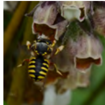
Een mannetje op wollig vingerhoedskruid.