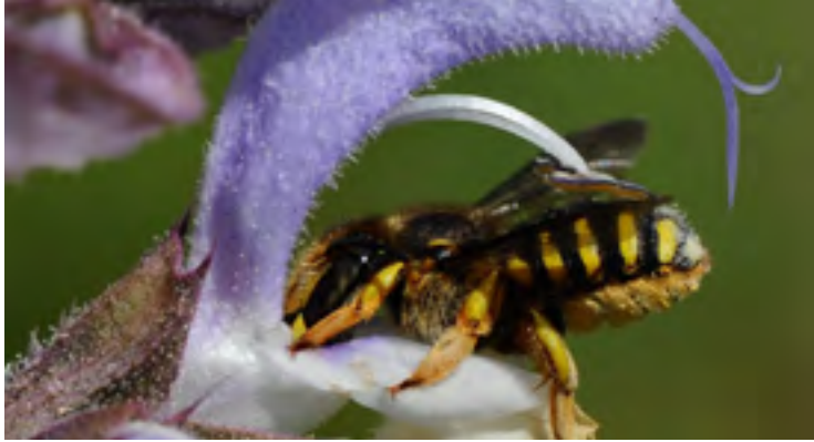
Een grote wolbij met onderbroken gele banden.

Honingbijen worden op een zeer gemene wijze aangevallen; in de meeste gevallen wordt een van de achterste vleugels afgebeten. De honingbijen kunnen dan niet meer vliegen en ook geen richting meer houden bij het lopen. Deze bijen sterven dan binnen enkele dagen. De bijen zijn dus niet kreupel, zoals dat ooit eens door Jac. P. Thijsse werd beschreven. Op plekken waar honingbijen foerageren en waar de grote wolbij talrijk voorkomt, kunnen tientallen aangevallen honingbijen op de grond rondkruipen.